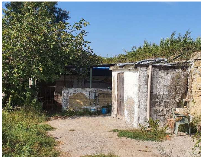
Manufatto in mattoni e lamiera