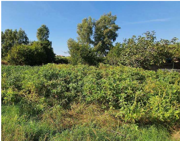
Panoramica del fondo