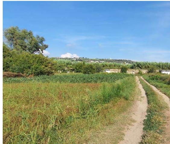
Coordinate: "40.833973, 14.052716"